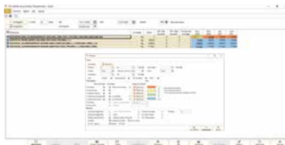
Gerar ordens de produção através de MRP

Seja de forma manual, diretamente com base numa encomenda ou através de MRP.