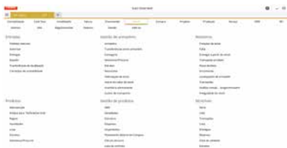
Configurações e setups iniciais

Torne todos os processos mais simples e garanta agilidade e rigor nas operações.