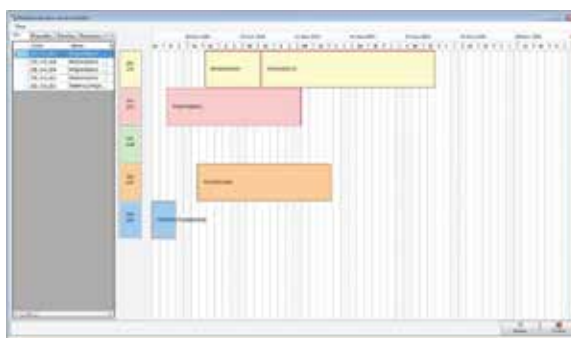
Planificador orientado às linhas de produção

Beneficie de um planeamento eficiente orientado às operações ou às linhas de produção.